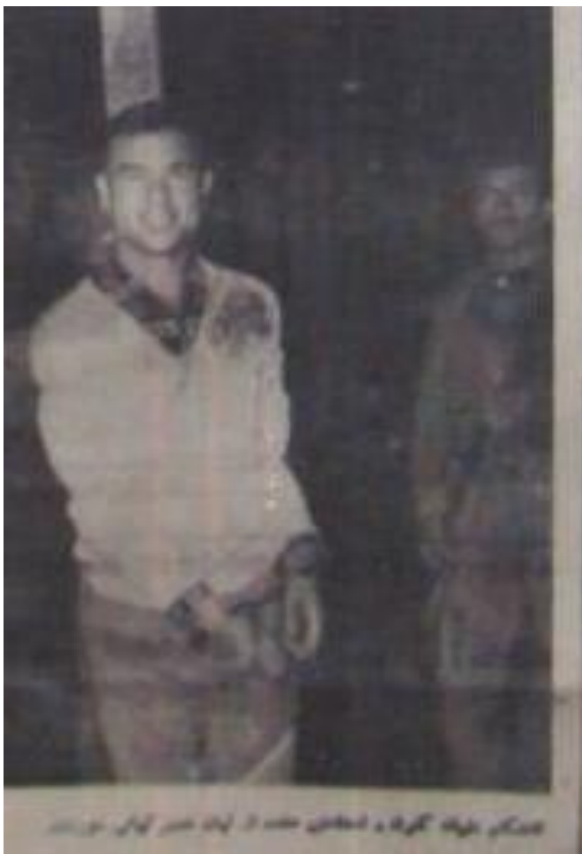
تا هنگام شلیک گلوله ، لحظه بی خنده از لبان نصیر کیانی دور نشد .